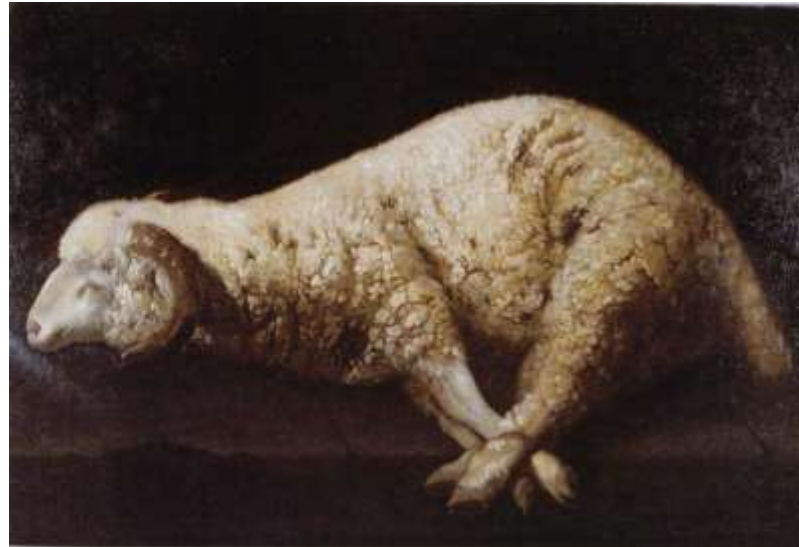
'Agnus Dei' (Lam van God), door de Spaanse schilder Francisco de Zurbarán (1632)

Dan ga ik op tot uw altaren, tot U, o bron van zaligheid. Dan mag mijn ziel uw heil ervaren en dankbaar ruisen alle snaren voor U die al mijn vreugde zijt en eindloos mij verblijdt. Verkondiging