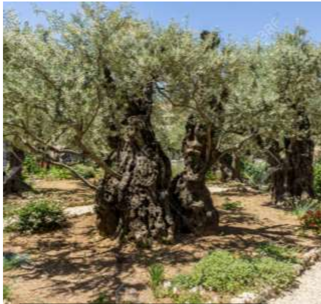
De olijfgaard (Hof van Getsemané) zoals die in onze tijd wordt aangewezen in Jeruzalem

God heb ik lief, want Hij is trouw mijn Heer, Hij hoort mijn stem, mijn smeken en mijn klagen. Hij richt zijn oor, 'k roep tot hem al mijn dagen, Hij geeft mij hulp, Hij redt mij keer op keer, ja Hij redt mij keer op keer.