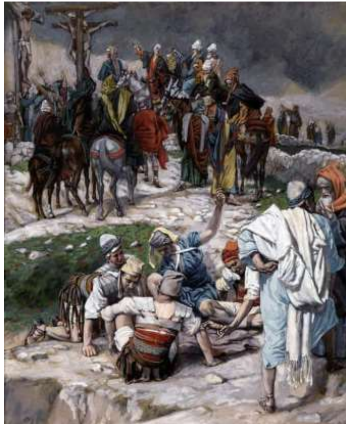
James Tissot (1836-1902): de dobbelende soldaten op de kruisheuvel Golgota

Alle leed hebt Gij geleden, Gij gedragen met geduld. Als een worm zijt Gij vertreden zonder schuld, om onze schuld, opdat wij door U verheven als verlost en zouden leven. Duizend, duizendmaal, o Heer, zij U daarvoor dank en eer.