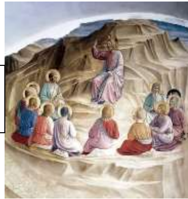
Fra Angelico (15 e eeuw): De Bergrede

Gij onderhoudt de vlam van ons bestaan. Aan U, o Heer, ontleent het brood zijn leven. Ons is een loflied in de mond gegeven, sinds Gij de weg van 't offer zijt gegaan.